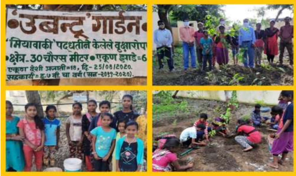
मियावाकी जपानी पद्धतीने 'उबंटू' गार्डनची निर्मिती करतांना विद्यार्थी