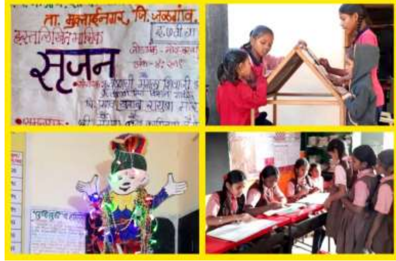
मुलांचा सृजन अंक व मानवता वाचनालय व युवा केंद्र