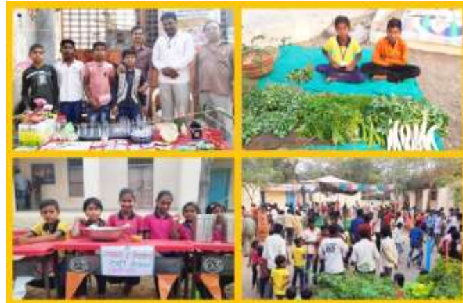
शाळेत आयोजित केलेल्या सृजन यात्रेचे बोलके चित्र