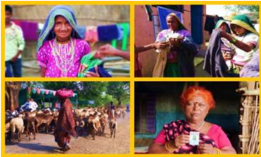
सातपुड्याच्या पायथ्याशी वास्तव्यास असलेला फासेपारधी समाज

Role of School Leadership in Inseminating Life Skills in Fasepardhi Dominated areas at the Foot of Satpuda in Maharashtra.