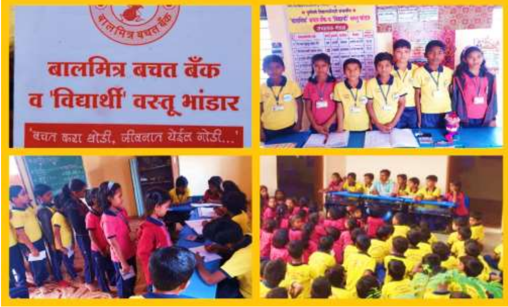
मुलांच्या बालमित्र बचत बँकेचा कारभार