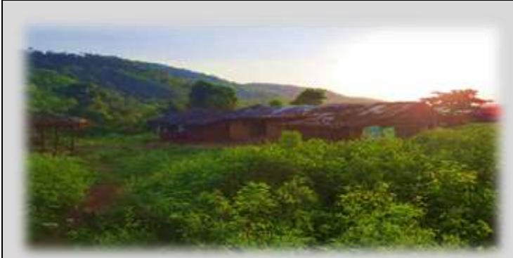
भोटा गाव परिसरात सातपुडा पर्वत रांगांतील डोंगराळ भाग