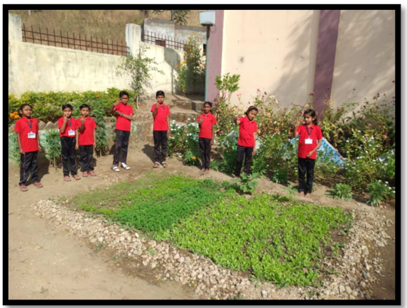
प्रधानमंत्री पोषणशक्ती अभियान अंतर्गत शाळेत विद्यार्थ्यांनी तयार केलेल्या परसबागेची वर्तमानपत्राने घेतलेली दखल