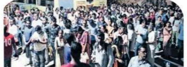
गुढीपाडव्याच्या पूर्वाह्न्यात जरगनगर येथील महापालिकेच्या श्रीमती लक्ष्मीबाई ज्ञान विद्यालयात मुलांच्या शाळा प्रवेशासाठी पालकांनी रांगा लावल्या होत्या.