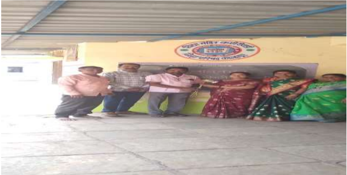
शाळेतील शिक्षक, गावकरी यांचे समवेत